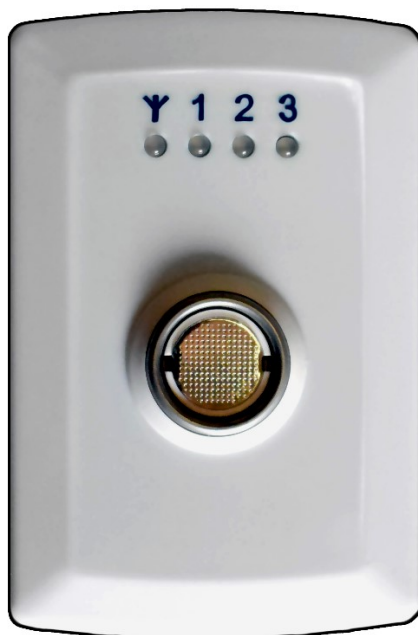
Рисунок 1 – Внешний вид прибора

К прибору через интерфейс Touch Memory (далее по тексту – ТМ ) могут быть подключены устройства, не входящие в комплект поставки: